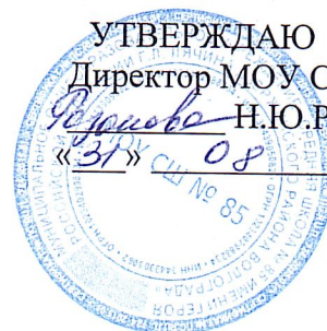
График работы столовой МОУ СШ № 85 в 2024/2025 учебном году